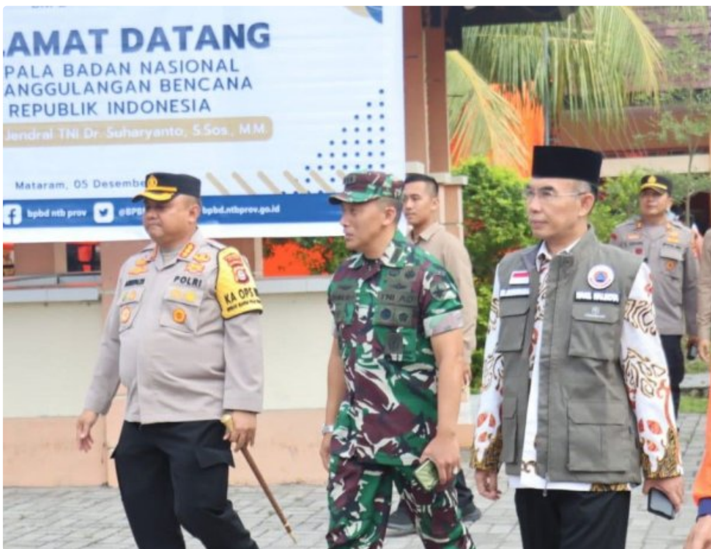
Kapolresta Mataram (Kiri) saat menghadiri acara Peletakan batu Pertama pembangunan gedung Pusdalops BPBD NTB, Kamis (05/12/2024)